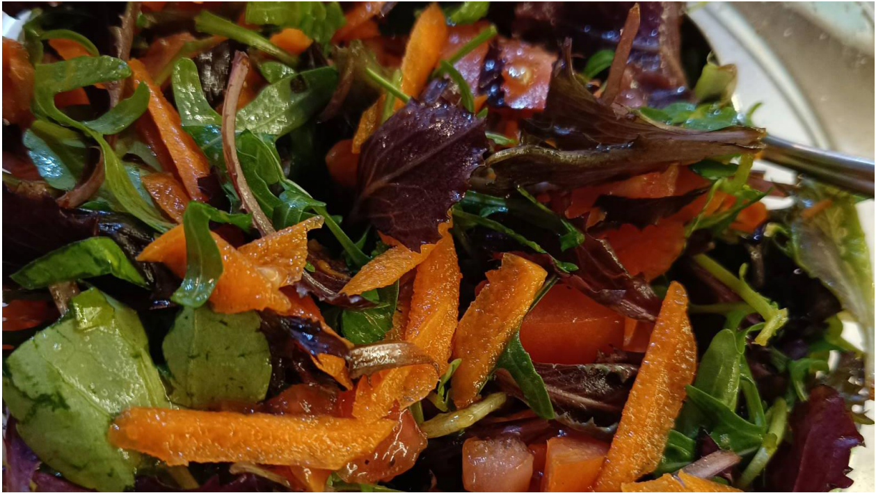
Einfache Salatbeilage mit Pflücksalat, Karotten und Tomaten