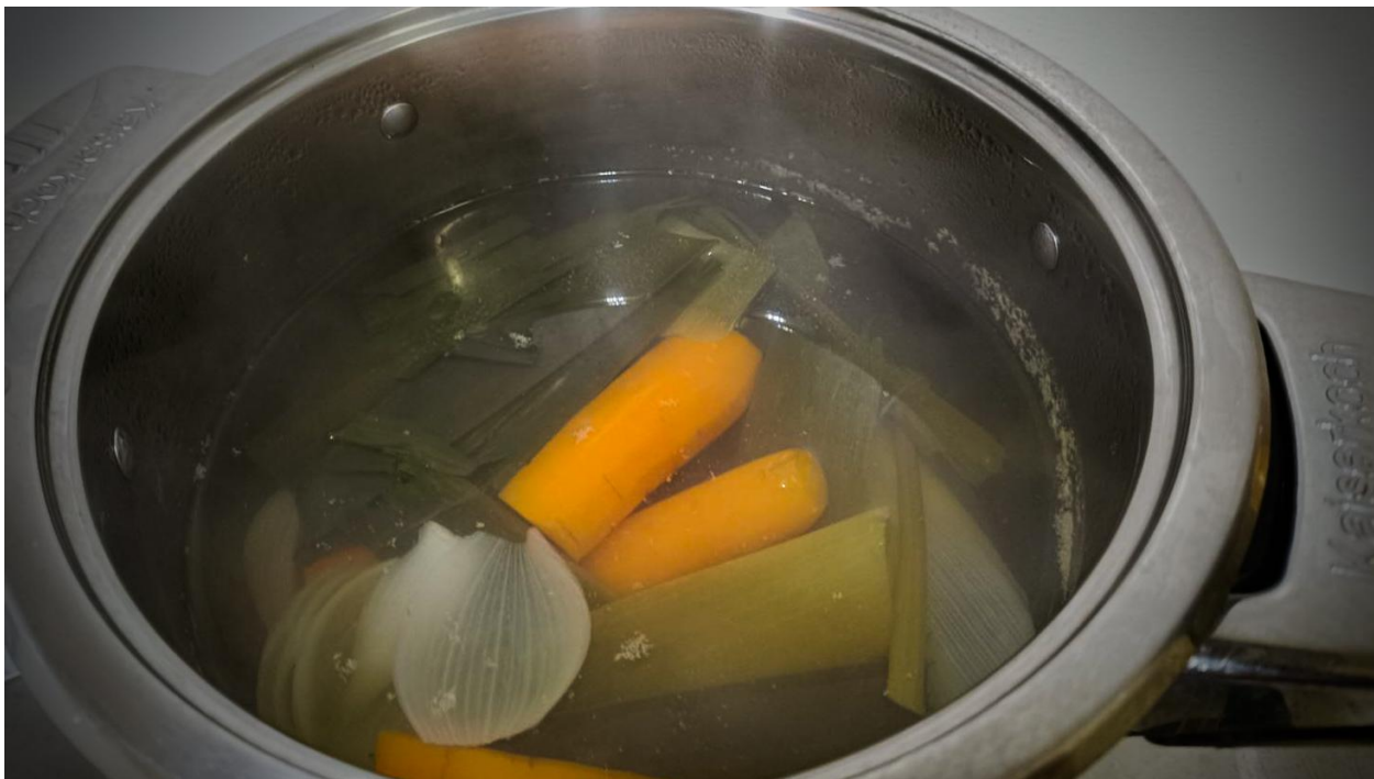
Gemüsebrühe selbst machen

Option 2: Koche 1,5 Liter Wasser mit 1 Tomate, 1 Zwiebel, 1 Karotte und übrig gebliebenem Porree 30 Minuten lang bei niedriger Hitze. Kein Salz hinzufügen! Die Brühe durch einen Durchschlag in einen Topf gießen und das ausgekochte Gemüse entsorgen.